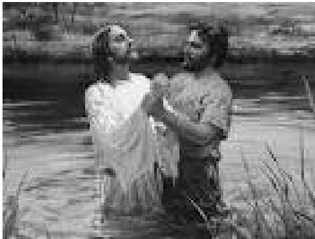
Bautismo de Jesús

Es claro que él fue El Cordero sin mancha y libre de pecado ( 1Pedro 1:19 ), sin duda que lo hizo por cumplir toda justicia, ( Mat 3:15 ), Él debió cumplir toda la palabra ( Mat. 5:17 ) y la palabra demandaba que el cordero de sacrificio antes de ser ofrecido fuese lavado.